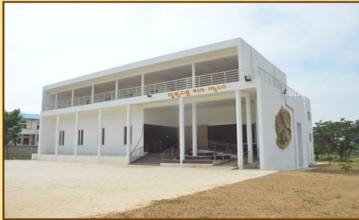
ದೃಶ್ಯವಿಶ್ವ ಕಲಾ ಗ್ಯಾಲರಿ

Admission of the candidates is subject to the final approval by the Registrar, Davangere University, Shivagangothri, Davangere Dist.